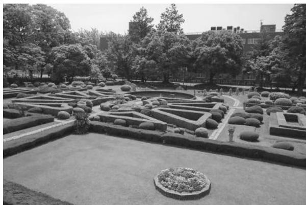
峰キャンパス フランス式庭園