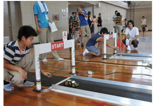
アイデアカーフェスタ