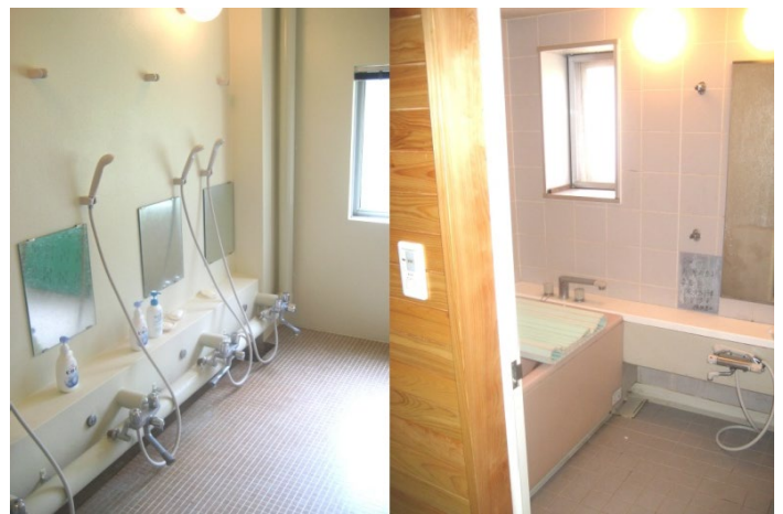
男性・女性 各浴室 有り