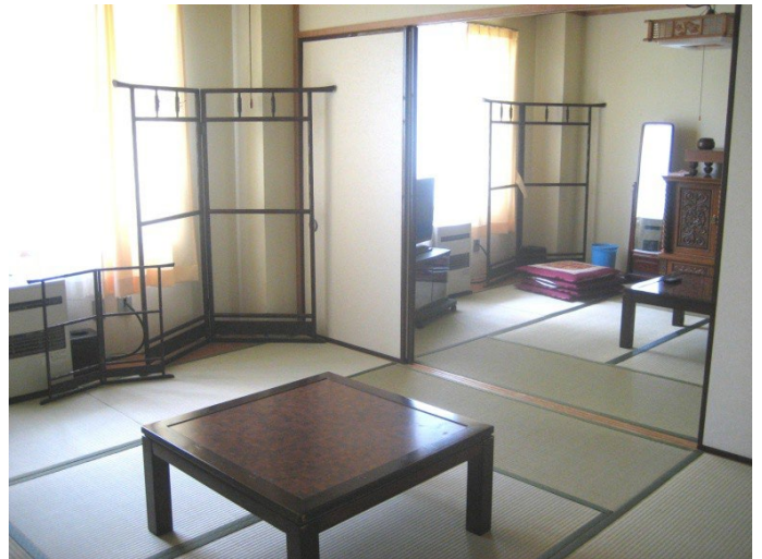
6畳和室が2部屋（二間続き）