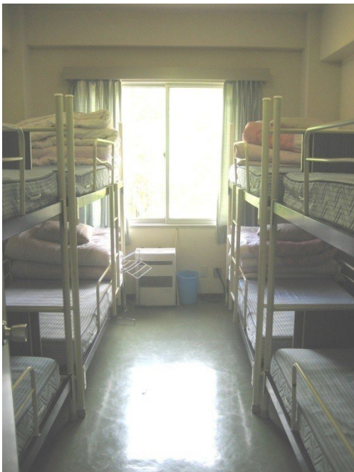
8人収容洋室が6部屋