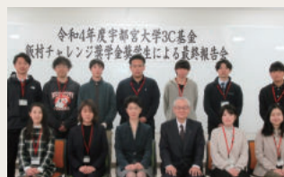
飯村チャレンジ奨学金報告会