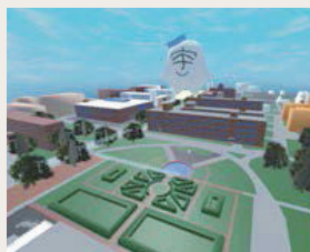
バーチャル宇都宮大学