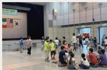
子ども国際理解サマースクール