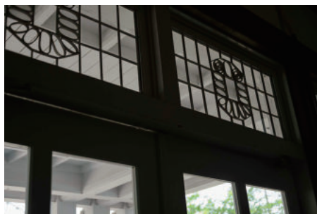
峰ヶ丘講堂エントランス飾り窓

峰ヶ丘講堂エントランス上部にある飾り窓の意匠をモチーフに、フクロウの形に「3C fund」の文字を入れています。栃木県の方言で、フクロウをホロスケットとすることから、「ほろ＝少し」と「助っ人」を組み合わせ、様々な活動に少しずつ支援を行う基金という意味をもつ「ホロスケット」と命名しました。3C基金の様々な広報活動に活用して参ります。