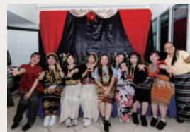
マレーシア英語研修 クロージングセレモニー

英語研修、インターンシップ、交換留学等の海外派遣プログラムに参加する学生への支援