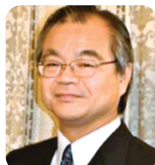
大谷 幸利 教授