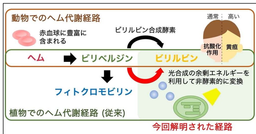
図1. 動植物におけるヘム分解経路とビリルビン産生

植物は動物とは異なり血液を持ちませんが、動物と同様にヘムを有し、酵素と結合することで、光合成や呼吸などのあらゆる細胞機能に重要な役割を果たしています。しかし植物における遊離ヘムは、葉緑体内の酵素によってビリベルジンに変換されるものの、動物とは異なり、ビリルビンには代謝されないと言われていました。これは主に、植物の抽出液からビリルビンを産生する酵素の活性が検出されないためでした。代わりに、ビリベルジンが、フィトクロモビルン* 2 という物質に代謝されるという植物特有の経路が存在します(図1)。しかし、植物細胞に含まれるフィトクロモビルンは、ヘムの総量よりも大幅に少ないと見積もられることから、私たちは植物では大部分のヘムが、フィトクロモビルンとは異なる物質に代謝されている可能性を考え、もししたら植物でもビリルビンが作られているのではないかと予想しました。