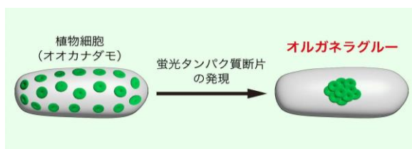
図2.通常の葉緑体分布(左)とオルガネラグルーによって接着した葉緑体の分布(右)

今回、研究グループは、BiFC 法の不可逆的な反応を利用し、オルガネラの接着制御に成功しました(図2)。