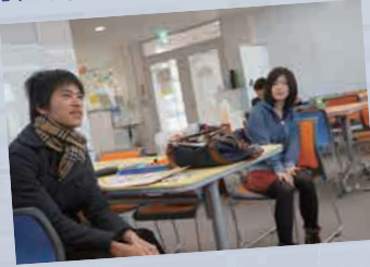
※峰キャンパスラーニングコモンズのみなさんに答えてもらいました！