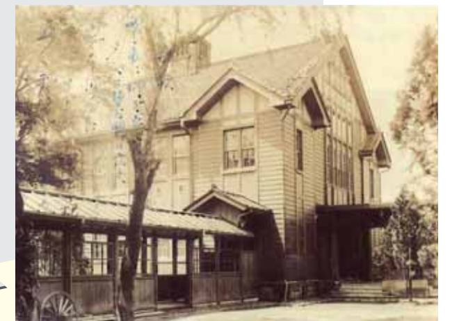
高等農林時代の講堂