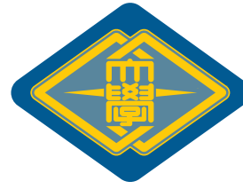
宇都宮大学校章 Symbol of Utsunomiya University

栃木県を象徴する男体山が中禅寺湖に映る雄姿を 図案化し、その中央に「大学」の文字を記したものを。