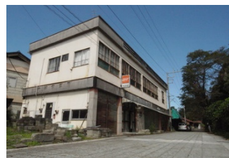
C.旧大谷レストハウス