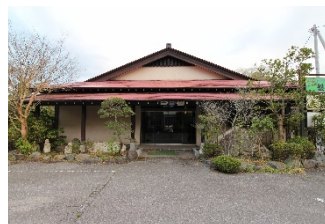
B.旧レストラン盤石