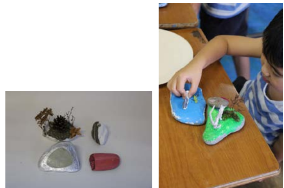
図(3-1). 「石にえがく・石でえがく」作品と製作風景