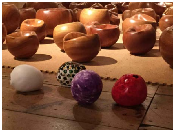
図(3-4). 「瞬間造形・ミミクリーズ」作品