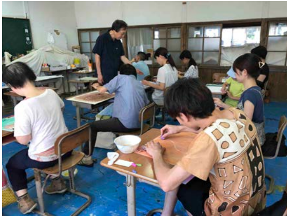
図(3-2). 「消しゴムで描く」風景