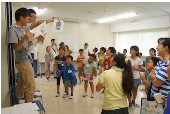
図 5. 休憩時間のクイズ