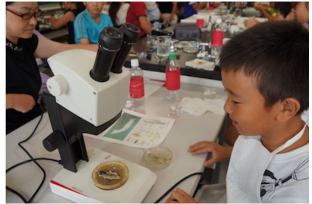
図 2. カイコの観察をしている様子