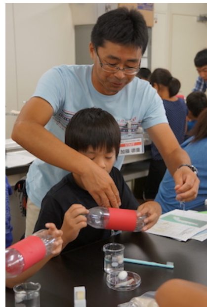
図 3. 繭から糸を巻き取る様子

講座には、参加児童 27 名に加え、弟妹 10 名、保護者 27 名の総勢 64 名が参加した。昨年度は、本学で受付を行ったために、E-mail での連絡の不具合などがあったが、今回、講座申込みはとちぎ子どもの未来創造大学を通じて行ったため、そのような問題は生じなかった。