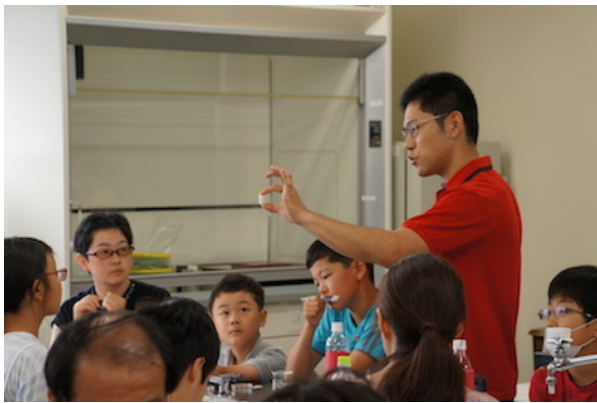
図 4. 繭の構造について説明する様子

供達は集中して実験に臨んだ。途中 15 分の休憩（次の実験準備を含む）をとった際には、気持ちが切れないように講座に関連したクイズを出したり、講座に関連した昆虫の標本を見ていただく等の工夫をした。特に、絹糸の構造色に絡めて、絹糸と同様に構造色を有する様々な昆虫の標本を展示し、これらの美しさに見とれる子供が多かった。また、ウイルスを利用した発光試験では、実際に光るということのインパクトもあり、バイオテクノロジーへの関心が非常に高まった様子が伺えた。本講座を通じて、たかが昆虫、昆虫ウイルスではなく、我々ヒトとは全く異なる方向へと進化した昆虫と昆虫を宿主とする昆虫ウイルスを、科学の側面から見直すきっかけになったようだ。