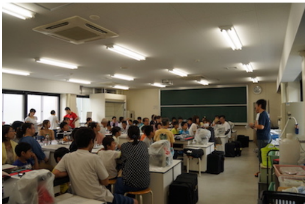
図 1. 体験教室の様子

開催日当日は、6名の学生ボランティアと共に8つのグループで実験と観察（①カイコの観察、②繭からの糸巻き、③カイコのウイルスの観察、④組換えウイルスによるカイコ体液の発光試験）を行った。