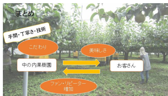
図 4 実習生のパワーポイント資料から