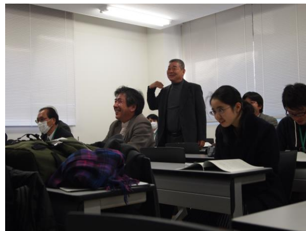
図 5 報告にコメントする農業士

実習生の発表とコメント、質疑応答の後、平成 28 年度の実習予定学生と受け入れ農家の対面式を行った。27 年度実習生の報告を聞いた直後ということもあって、初めての顔合わせであるにもかかわらず、和やかな雰囲気の下、活発な交流・意見交換が実施できた。