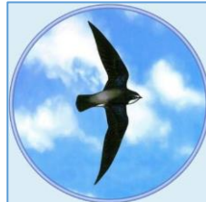
コミュニティ・カフェ おおぞら

市貝町内 3 カ所でいちがい子育てネット羽ばたきが運営。家族の団らんや豊かな食を中心に、地域のコミュニティを盛り上げていく取り組みを行う。