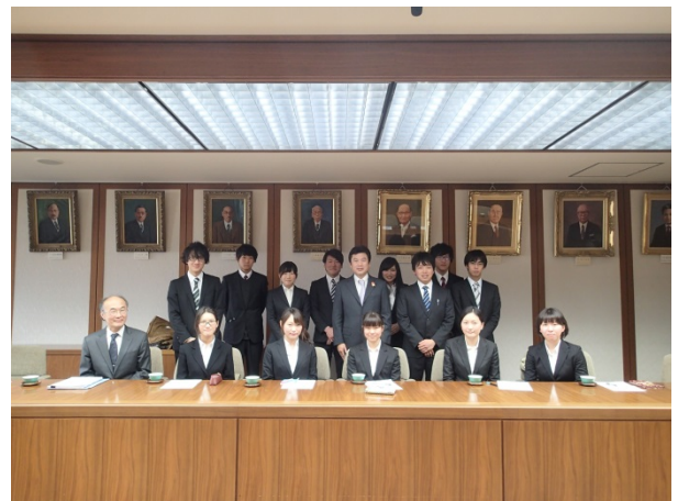
市長インタビュー