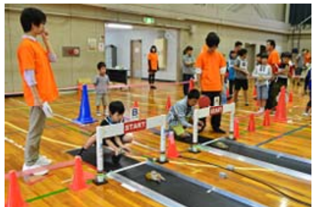
アイデアカーフェスタ